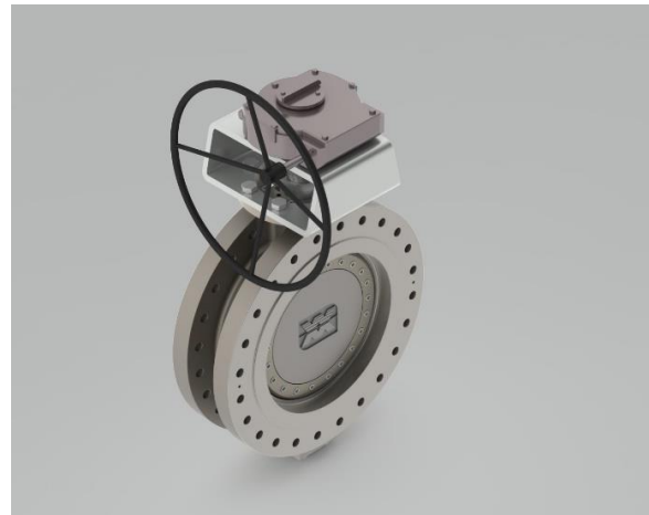
Klappe in Doppelflanschausführung mit Handgetriebe

müller quadax gmbh , als Teil der müller co-ax ag, verfügt über 60 Jahre Erfahrung in der Herstellung von Industriearmaturen. Hier wurden unter anderem die 4-fach exzentrischen Absperrklappen Quadax® entwickelt, die eine neue Dimension der Sicherheit etabliert haben. Heute verfügt das innovative Unternehmen über voll ausgestattete 5-Achs-Bearbeitungszentren, die gewährleisten, dass der Produktionsprozess zu den modernsten der Welt gehört. Auch die umfassende Expertise des Unternehmens machen die Quadax Armaturen zum Mittel der Wahl – gerade bei Anwendungen, wo extreme Bedingungen vorherrschen und kompromisslose Qualität unabdingbar ist. Sicherheit durch eigene Produktion – 100% Made in Germany.